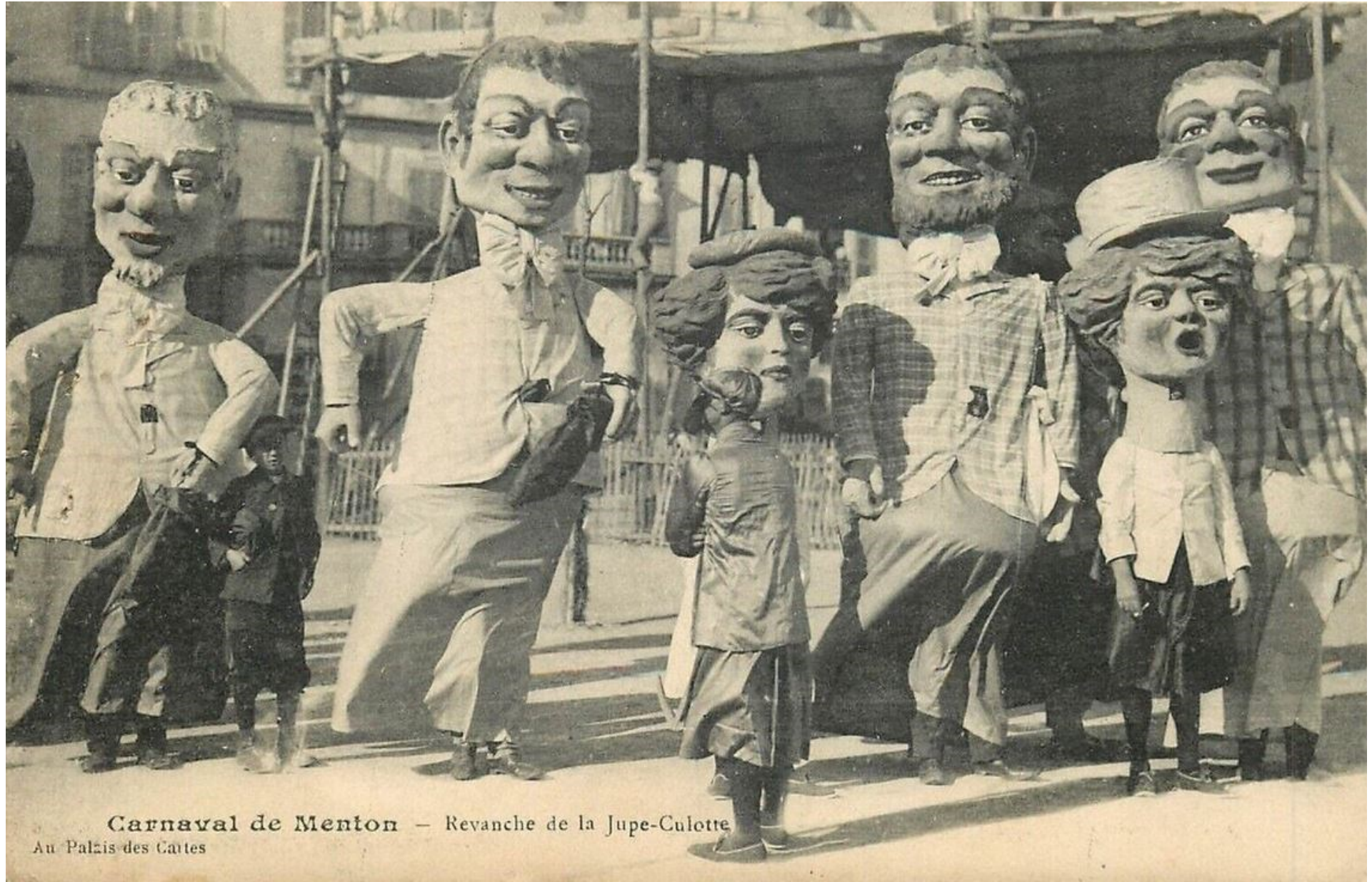
Carnaval de Menton — Revanche de la Jupe-Culotte Au Palais des Cartes