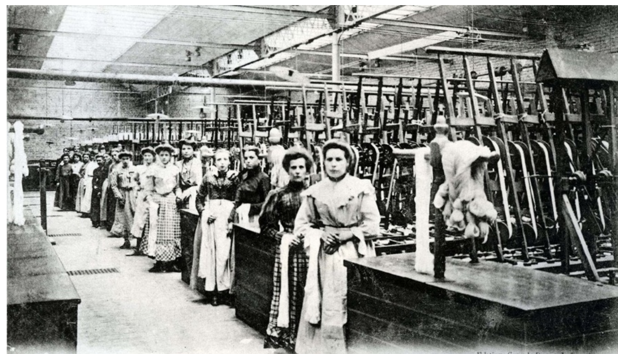
7. - CALAIS. - L'industrie tulleière. - Le Dévidage.