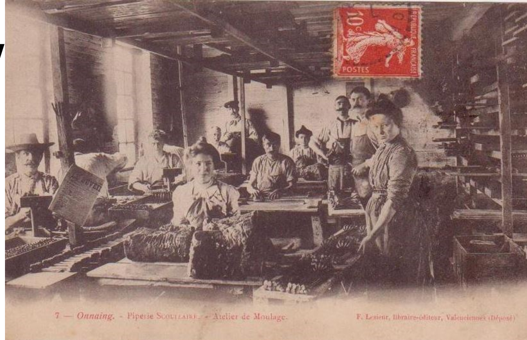
7 - Onnaing. - Pipeuse SCOTLAISE. - Atelier de Moulage.