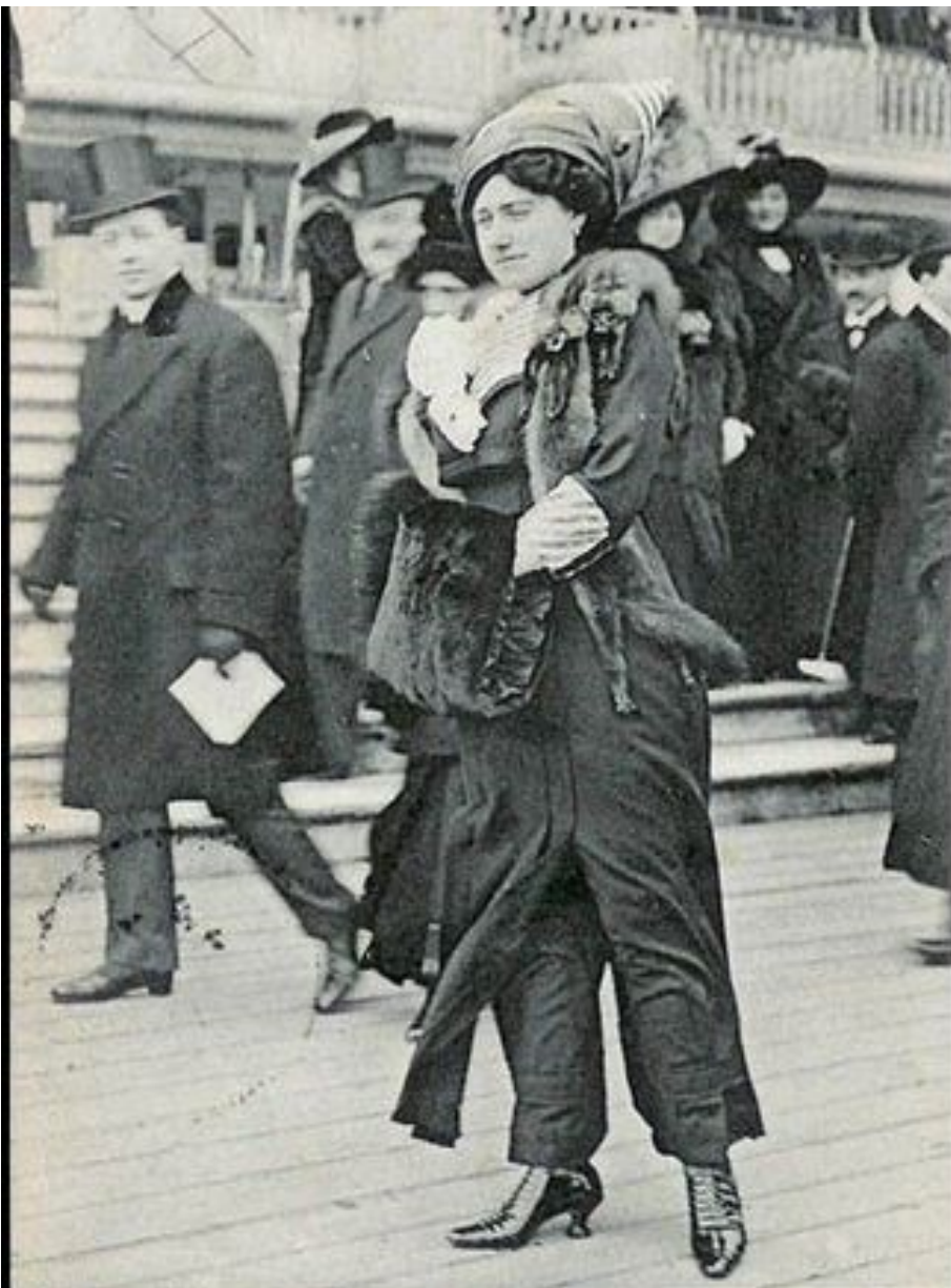
LA QUESTION EST POSEE : portera t-on la jupe-pantalon en 1911 ? ? Présentée à la Comédie-Française à la Générale d' « Après moi », elle a indigné le public. Aux Courses d'Auteuil, l'accueil a été plus gai, elle a fait la joie des habitués, intrigués par ces dessous mystérieux et nouveaux.