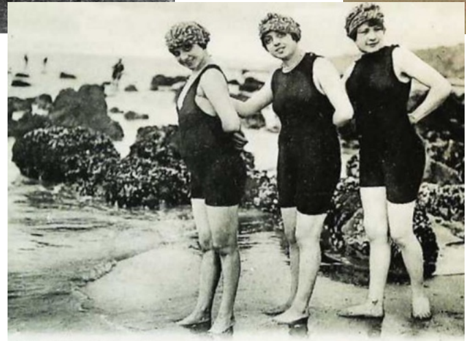
5031 Trois grâces. - L.L.