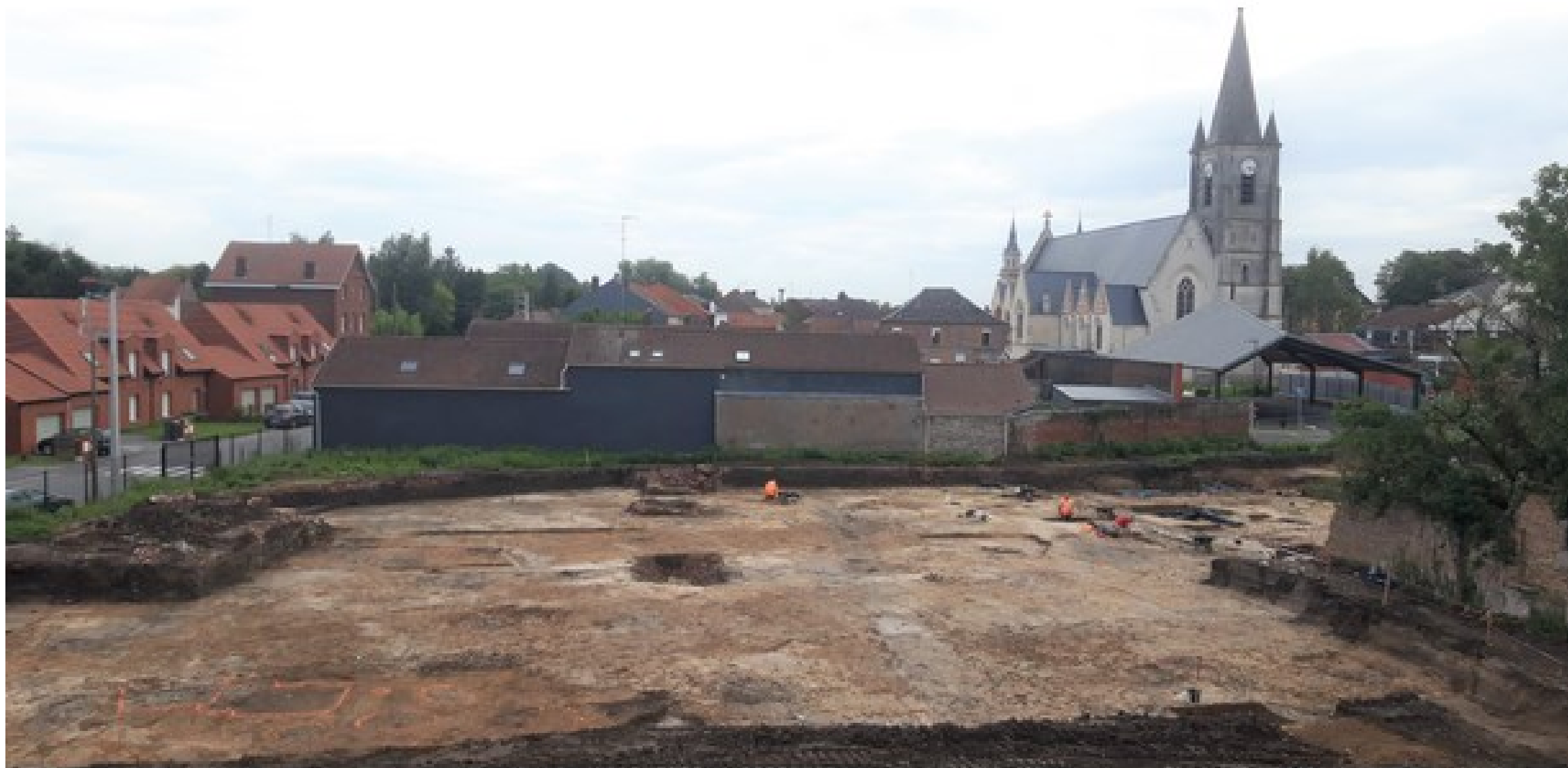
Vue du chantier d'Onnaing.