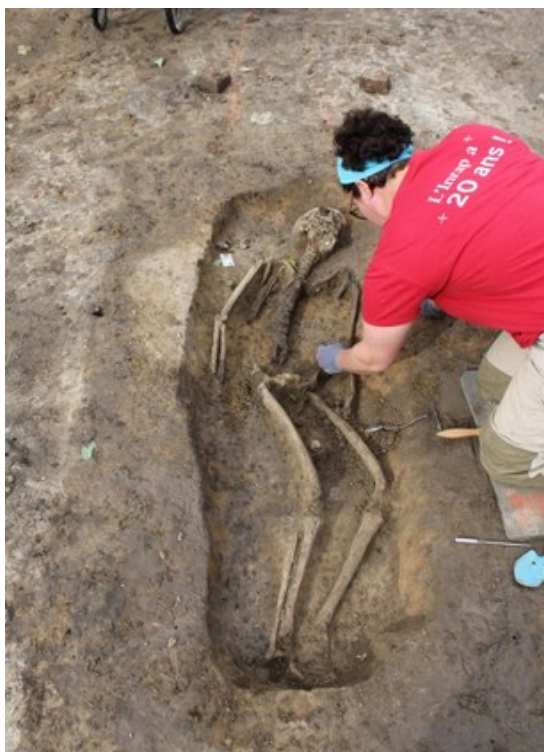
Sépulture en cours de fouille.