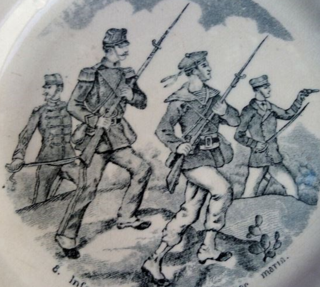
8. Infanterie de marine. Fusilier marin.