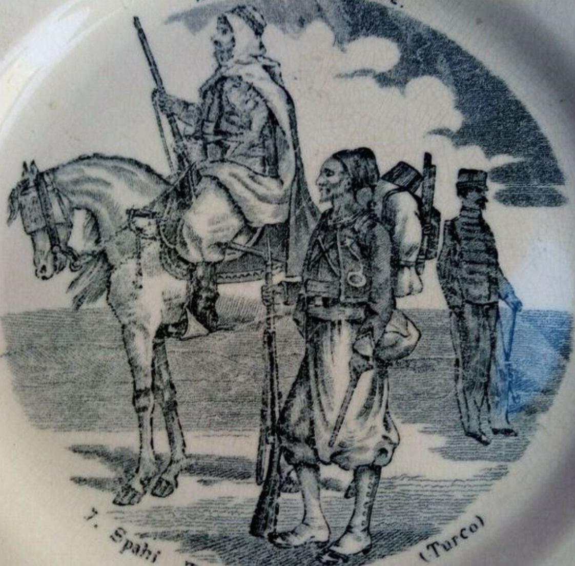
7. Spahi Tirailleur Algérien. (Turco)