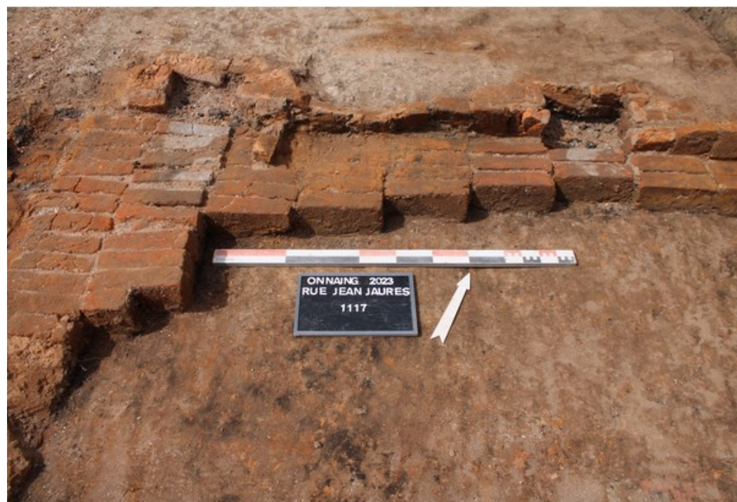
Briques encore en place sur la sole du four à briques.