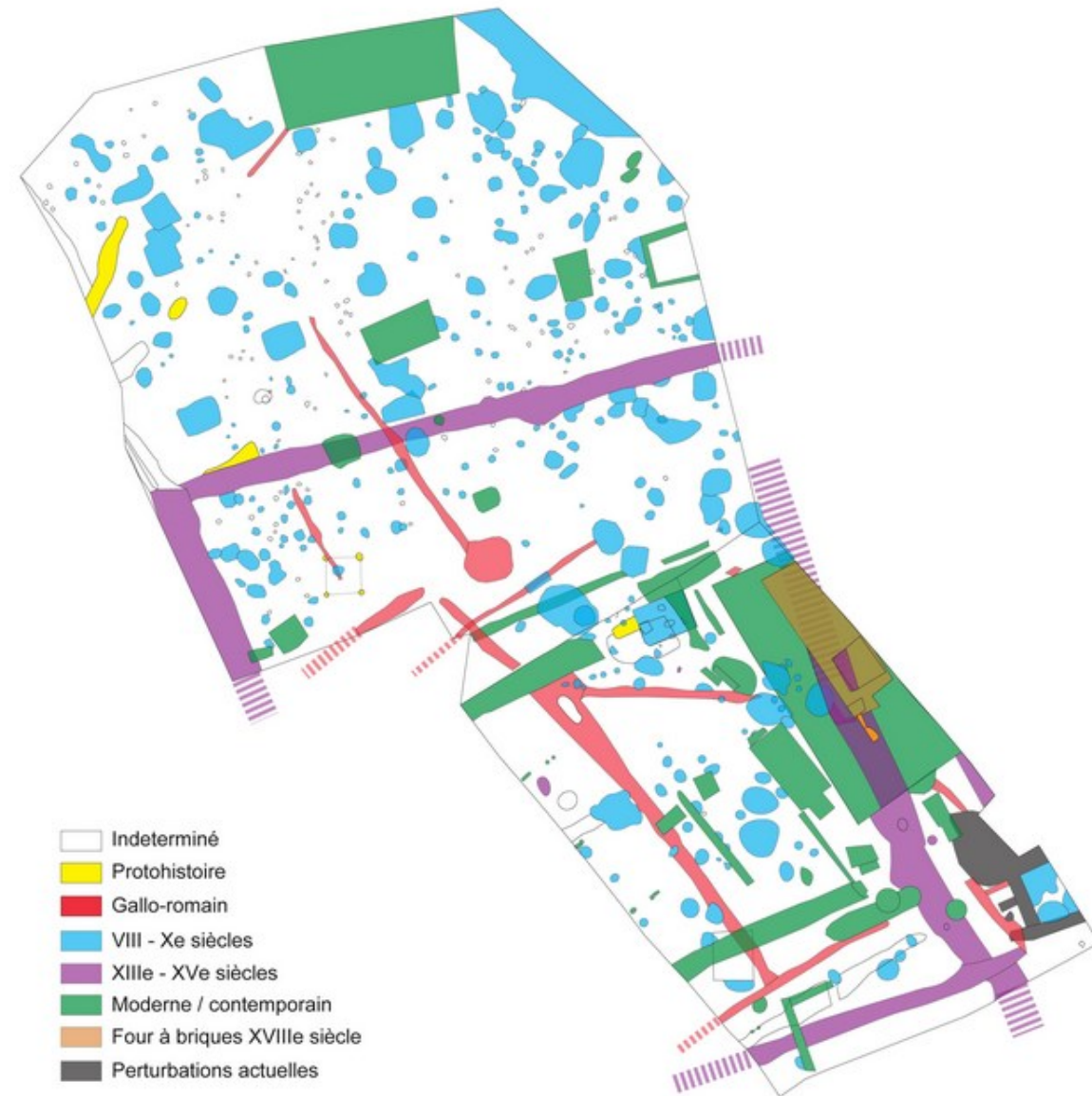
Plan de la fouille d'Onnaing.