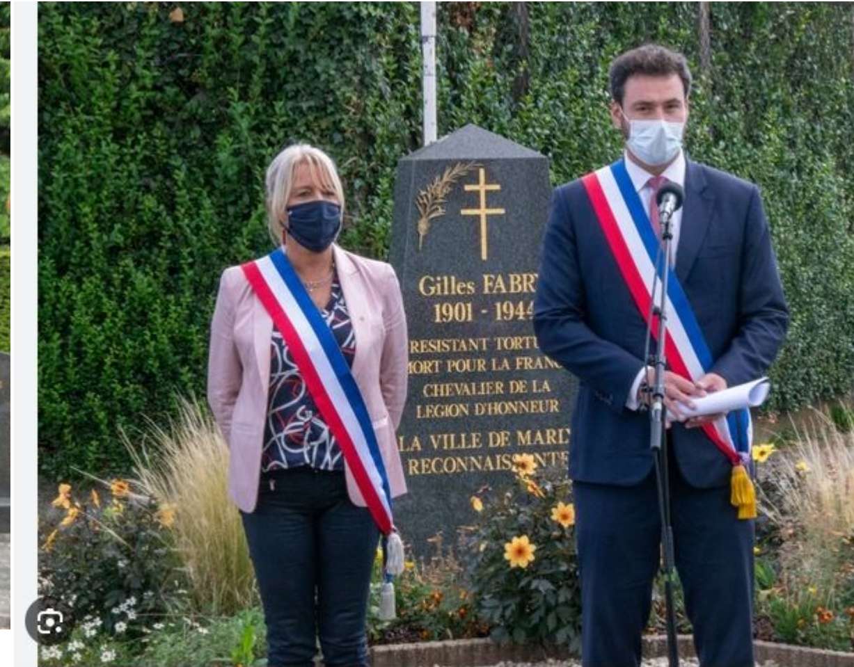
2 et 3 septembre 1944 - 76ème anniversaire de la Libération de Marly, de Valenciennes et Saint-Saulve