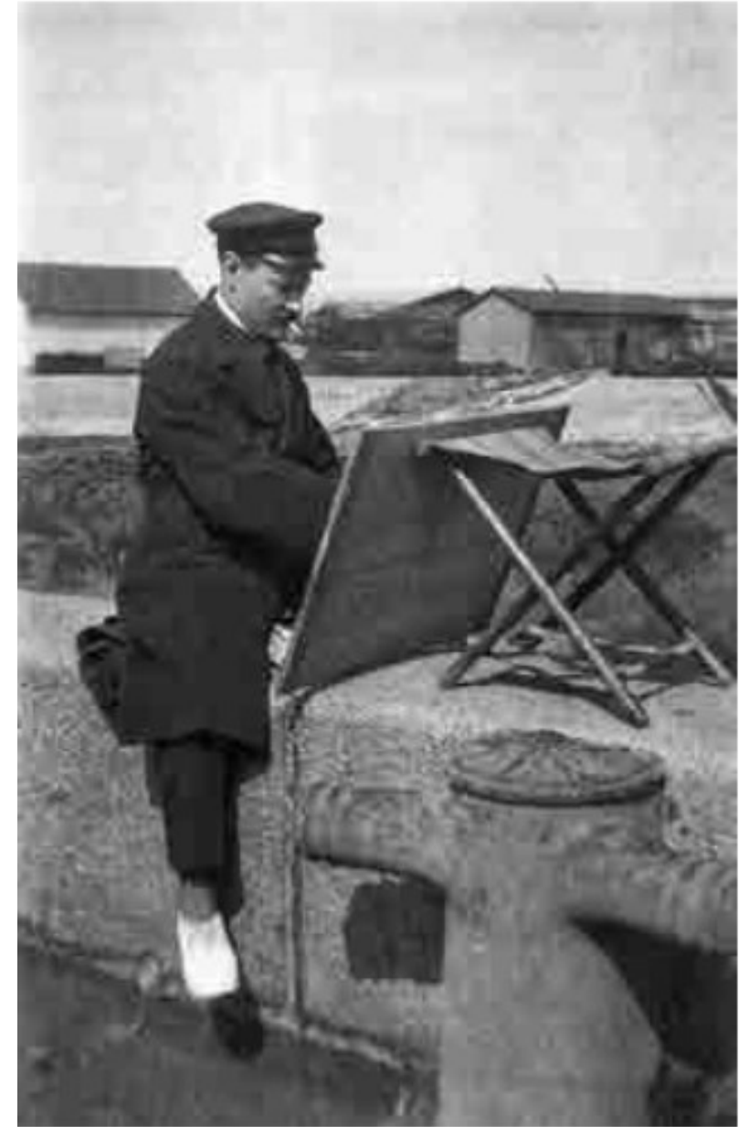
Paul-Élie Gernez sur le motif à Honfleur Photographie, 1920