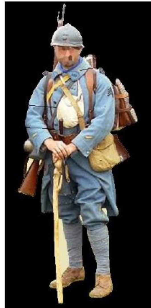
Uniforme de 1917-1918