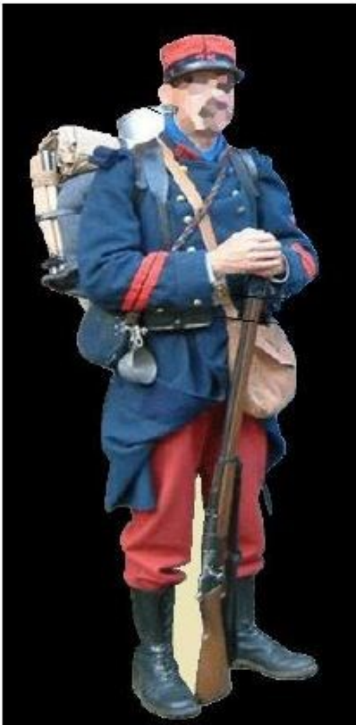
Uniforme d'août 1914