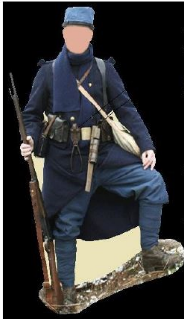
Uniforme de l'hiver 1914