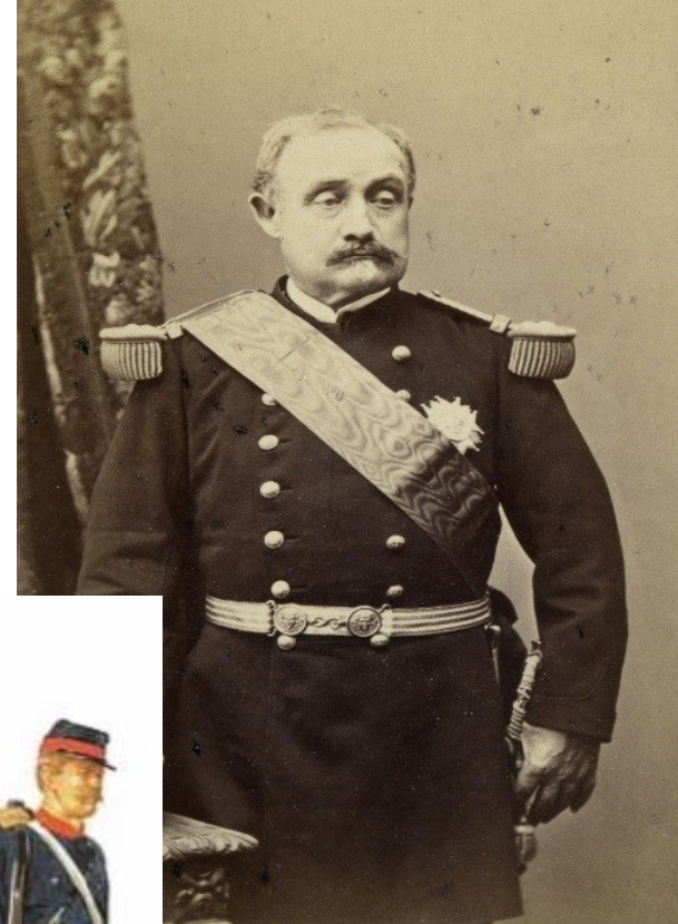
Officier et soldats de l'armée française (1870).